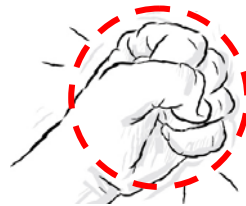
Puño =1 taza