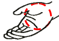
La palma de la mano=3 onzas

Hoy en día los alimentos se venden en tamaños más grandes que en el pasado, por lo tanto comemos más de lo que deberíamos. Para comer menos: